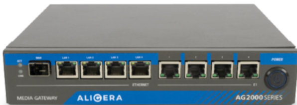
AG2000 2EIs até 4EIs até 120 canais

Link: https://aligera.com.br/novo/media-gateway-ss7/